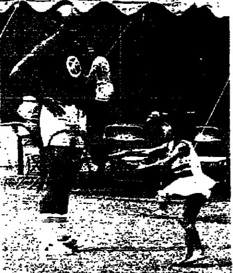
لاعب التنس يوب هويت (أستراليا) مع ابنته (الجنوبية) مع ابنته في فترة استراحة بين المباريات التي تقام في نطاق بطولة التنس العالمية في نورست هيلز